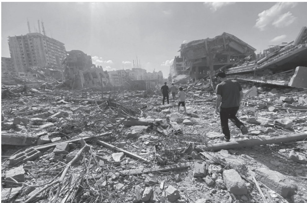
Фиг. 2. Мястото, където се провежда фестивалът „Супернова“, ден след нападението на 7 октомври 2023 г.