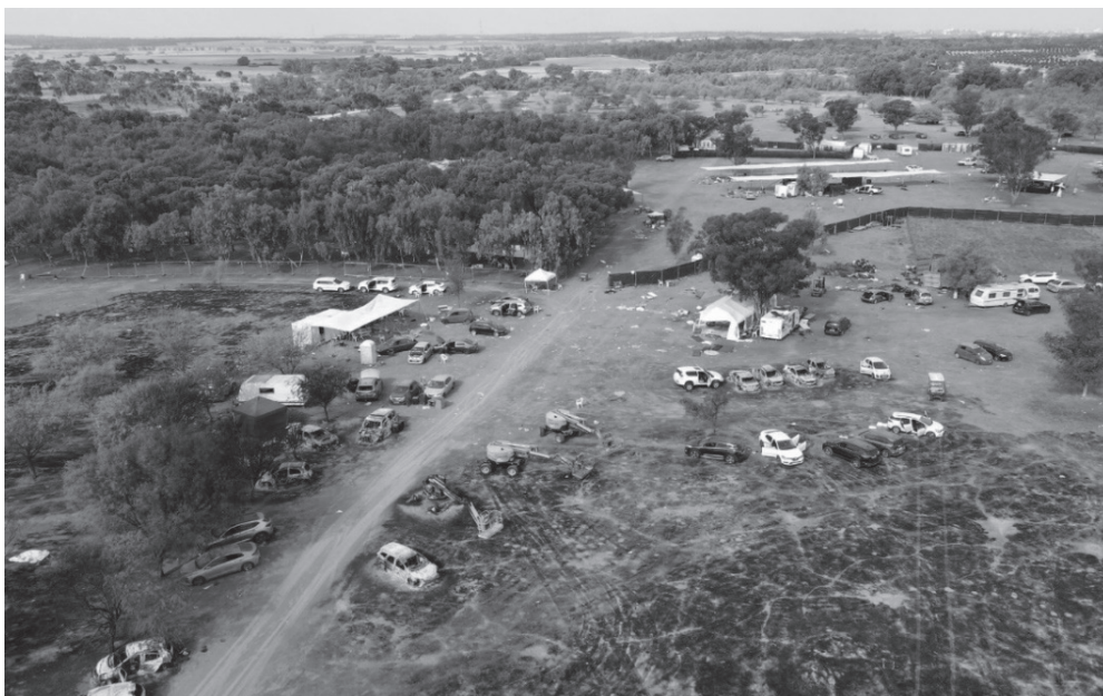
Фиг. 3. Първи ответни удари от страна на Израел към Газа след 7 октомври 2023 г.