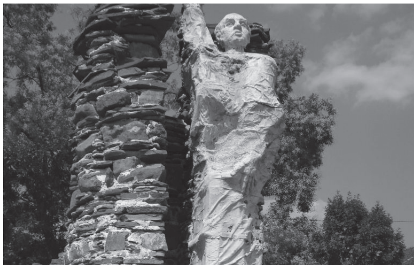
Фиг. 4. Паметник на Петър Богдан Бакшев в гр. Чипровци

Можем да предполагаме, че скритата идея на Петър Богдан Бакшев е не само да представи географските характеристики на българските земи, но и да предизвика интерес на европейските владетели към тази част на континента, а оттук да се постави на дневен ред въпросът със съдбата на българския народ и потенциалното възстановяване на българската национална държава. Това ясно прозира в директното обръщение на автора – „Ако това царство би имало един владетел християнин...“ .