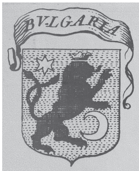
Фиг. 2. Герб на България, създаден от Петър Богдан Бакшев

Показателни за развитие на национална идея са сведенията, които черпим от писмата на Петър Богдан Бакшев до Венецианския сенат, изпращани от Чипровци през 1673 г.: „Народът на България е готов да въстане и се освободи от тежкото робство, очаквайки отново да му се притече на помощ обединена духовно и с оръжие Европа.“ „А защитата на честта, още повече тази на родината, надминава всичко, защото животът и честта са равнооставени“ .