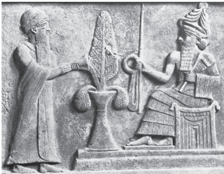
Фиг. 2. Фрагмент от стелата, намерена в Ур, Междуречието (дн. Ирак), в която цар Ур-Наму получава заповед за построяване на зикурата в Ур от лунния бог Син – „носещият светлина“ (стелата е изложена в историческия музей в Багдат)

граждането на храма самият Бог Син го освещава и поема покровителството над целия град Ур.