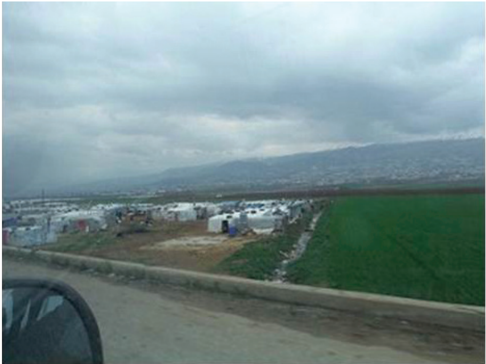
Фиг. 2. Палатков сирийски бежански лагер по пътя Баалбек – Захла, долина Бекаа