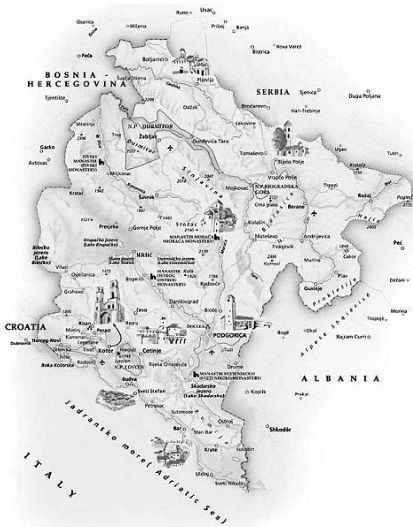
Фиг. 1. Черна гора