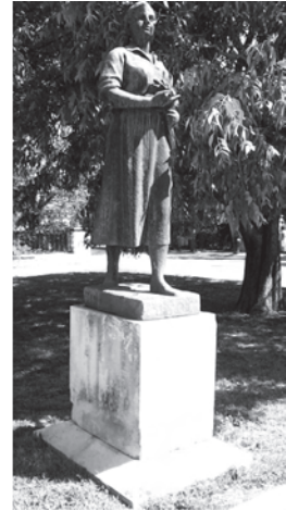
Фиг. 10. Фигурата „Жътварката“, бул. „Христо Ботев“