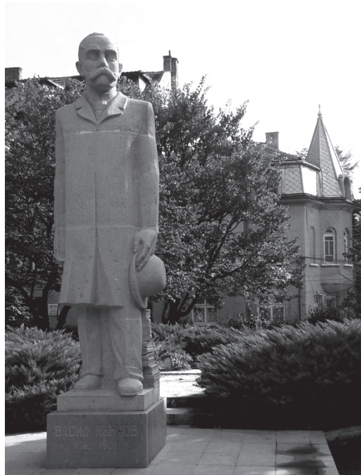
Фиг. 12. Паметникът на Васил Кънчов.