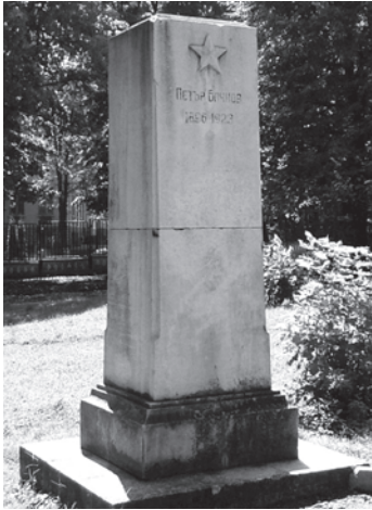
Фиг. 8. Оцелелият постамент на бюст-памятника на Петър Бачков, в близост до пл. „Левски“