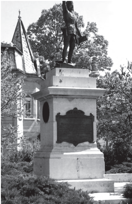
Фиг. 11. Първият паметник на Христо Ботев, „престоил“ няколко години в градинката на пл. „Руски“.