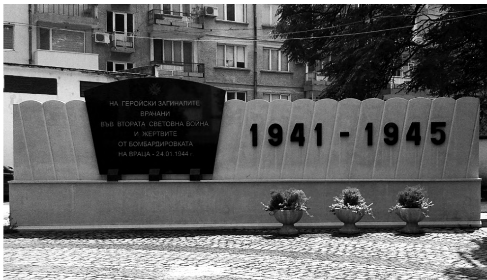
Фиг. 6. Паметник на жертвите от бомбардировката на Враца

урбанистичната история на гр. Враца социализмът е специфичен етап и изграждането на паметници е с цел възвеличаване на комунистическата революция и победата на народната власт след 9 септември 1944 г. Радикалното идеологизиране на местата на национална памет най-добре илюстрира замяната на опълченския кръст на вр. Вола с бетонна петолъчка, демонтирана след 1990 г.