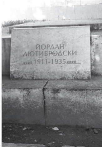
Фиг. 9. Оцелелите основи на паметника на Йордан Лютибродски, бул. „Никола Войводов“