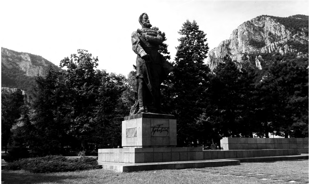
Фиг. 2. Паметникът на Христо Ботев на едноименния централен площад на гр. Враца, умело вписан от скулптора Вл. Гиновски в мащаба и естетиката на окръжаващата природна среда – северните склонове на Врачанския балкан

бивани в земята кръстове. Затова първите мемориални знаци за Ботевата чета и освободителните борби са били тежки каменни кръстове, поставени по пътя от Козлодуй до Околчица (А н г е л о в, 1984: 140).