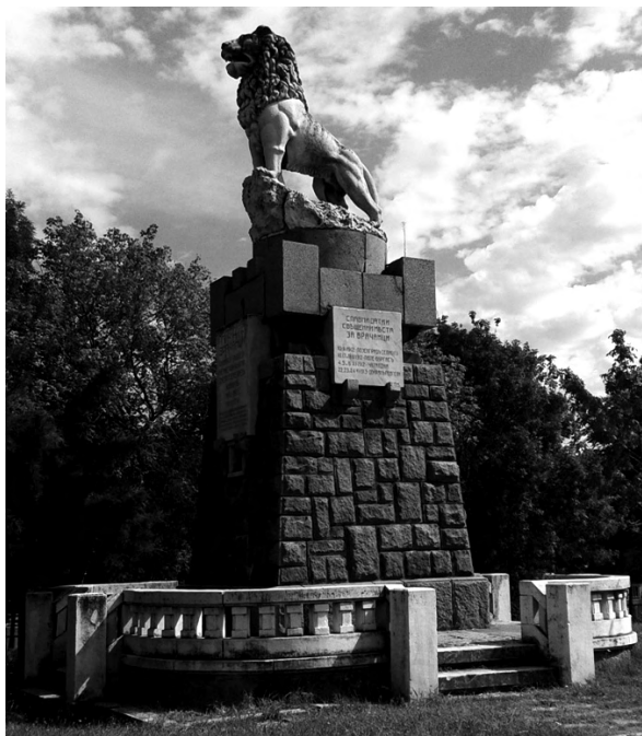
Фиг. 5. Паметникът на загиналите във войните

Паметници на загиналите във войните за защита на отечеството врачани. Сравнително отдалечен от културно-историческия център на града е Паметникът на загиналите във войните, разположен в близост до жп гарата. Той представлява фигура на лъв, издигнат на висок постамент – националният символ на България и на героизма на защитниците на родината. Той е поставен през 1932 г. в чест на врачани, загинали по време на Балканската, Междусъюзническата, Първата и Втората световна война. Този паметник е един от ярките материални символи на приноса на жителите на града към защитата на България по време на войните от първата половина на XX в. Изписаните върху стените на паметника „свещени места за врачанци“ подчертават значимите за топографията на българската историческа памет места на водени битки: Неготин, Връшка чука, Ниш, Добрич, Кубадин, Битоля, Охрид, Дойран, Лозенград, Чаталжда и др. Със своите естетически качества и въздействащ силует, монументът има огромна роля за съхраняването на паметта за загиналите български войни. Паметна плоча с имената на загиналите във войните врачани е поставена също на източната фасада на Военния клуб.