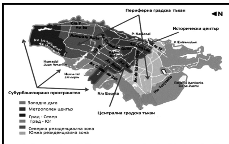
Фиг. 2. Видове градско пространство в Богота